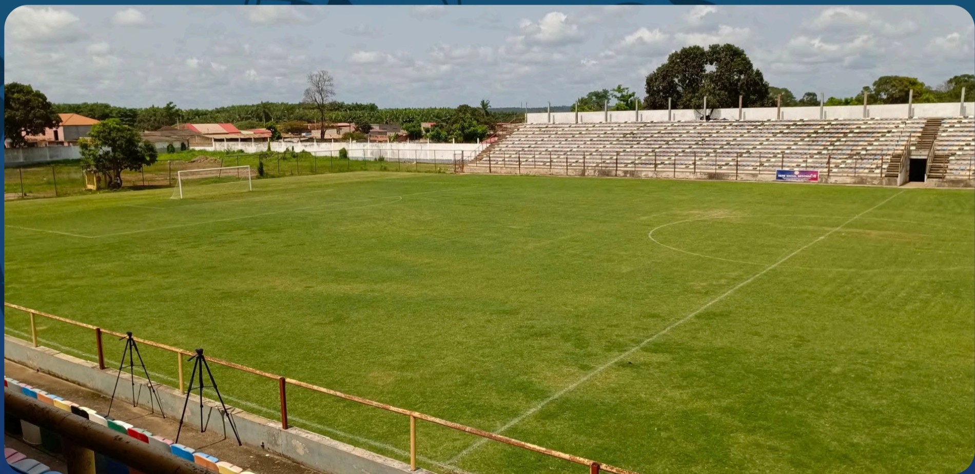
Estádio Municipal do Dande