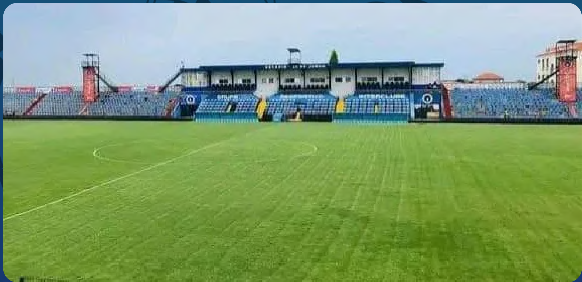
Estádio 22 de Junho