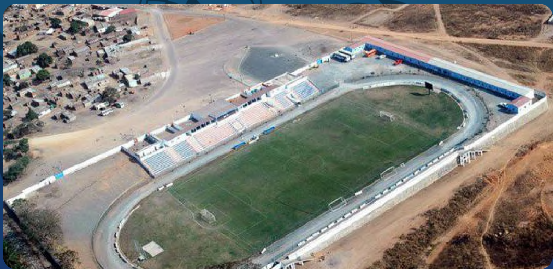
Estádio de Calulo