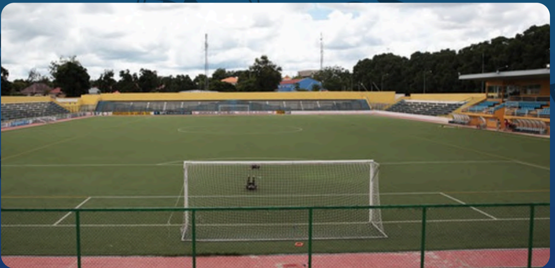
Estádio das Mangueiras