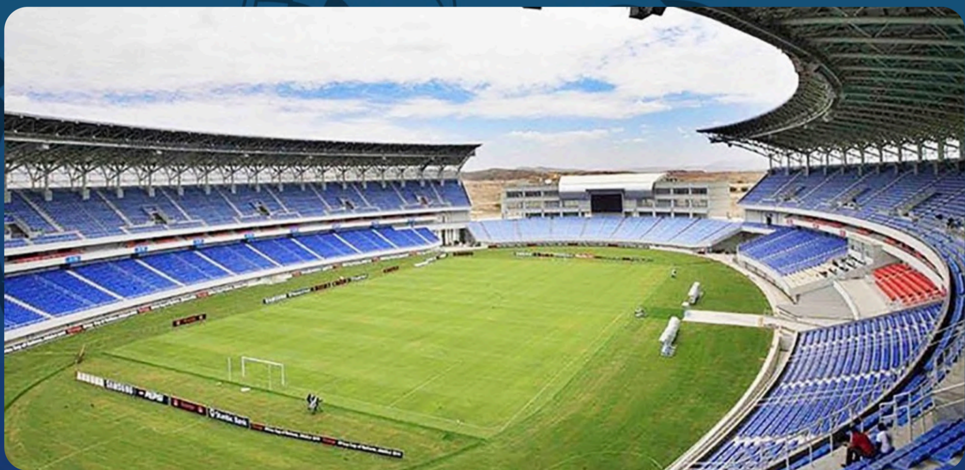
Estádio da Tundavala