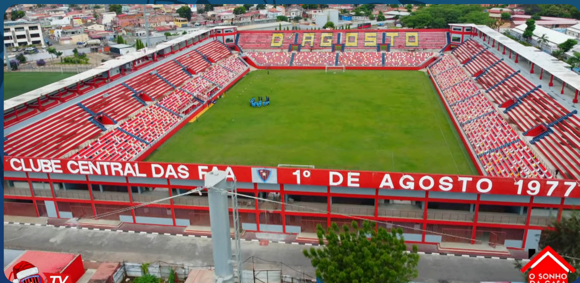
Estádio França Ndalú