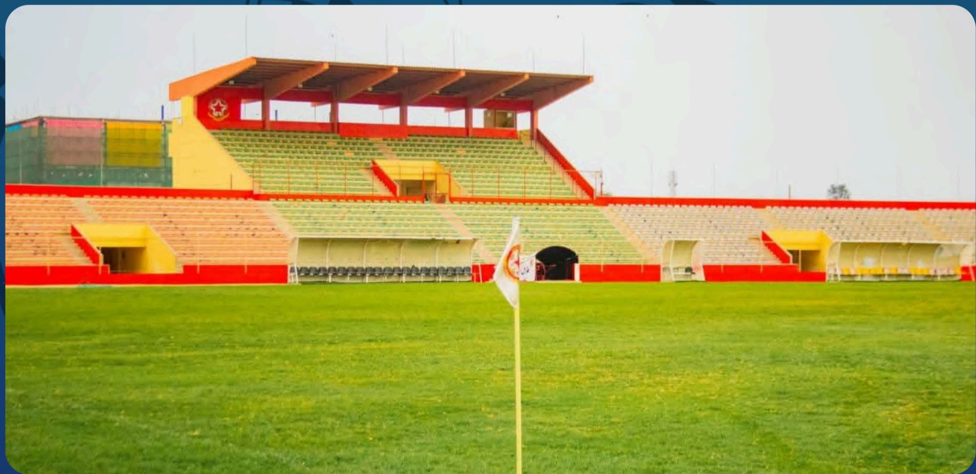
Estádio Municipal dos Navegantes