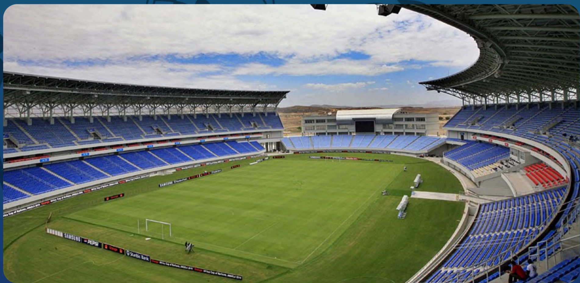
Estádio de Ombaka