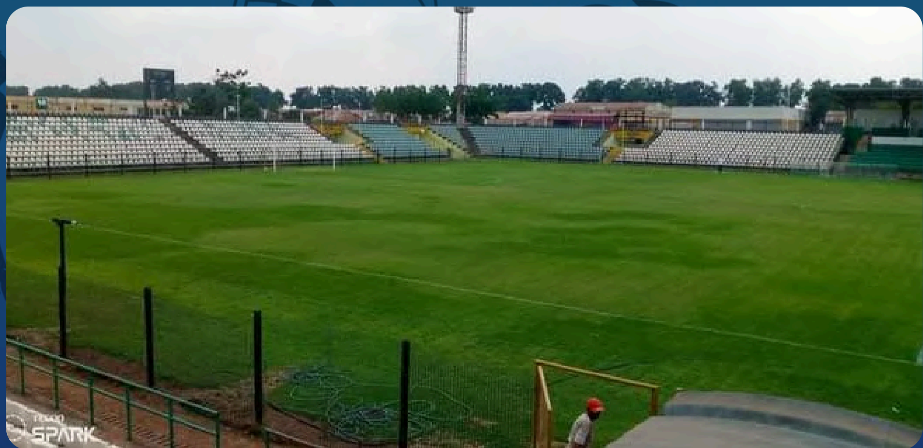
Estádio Sagrada Esperança