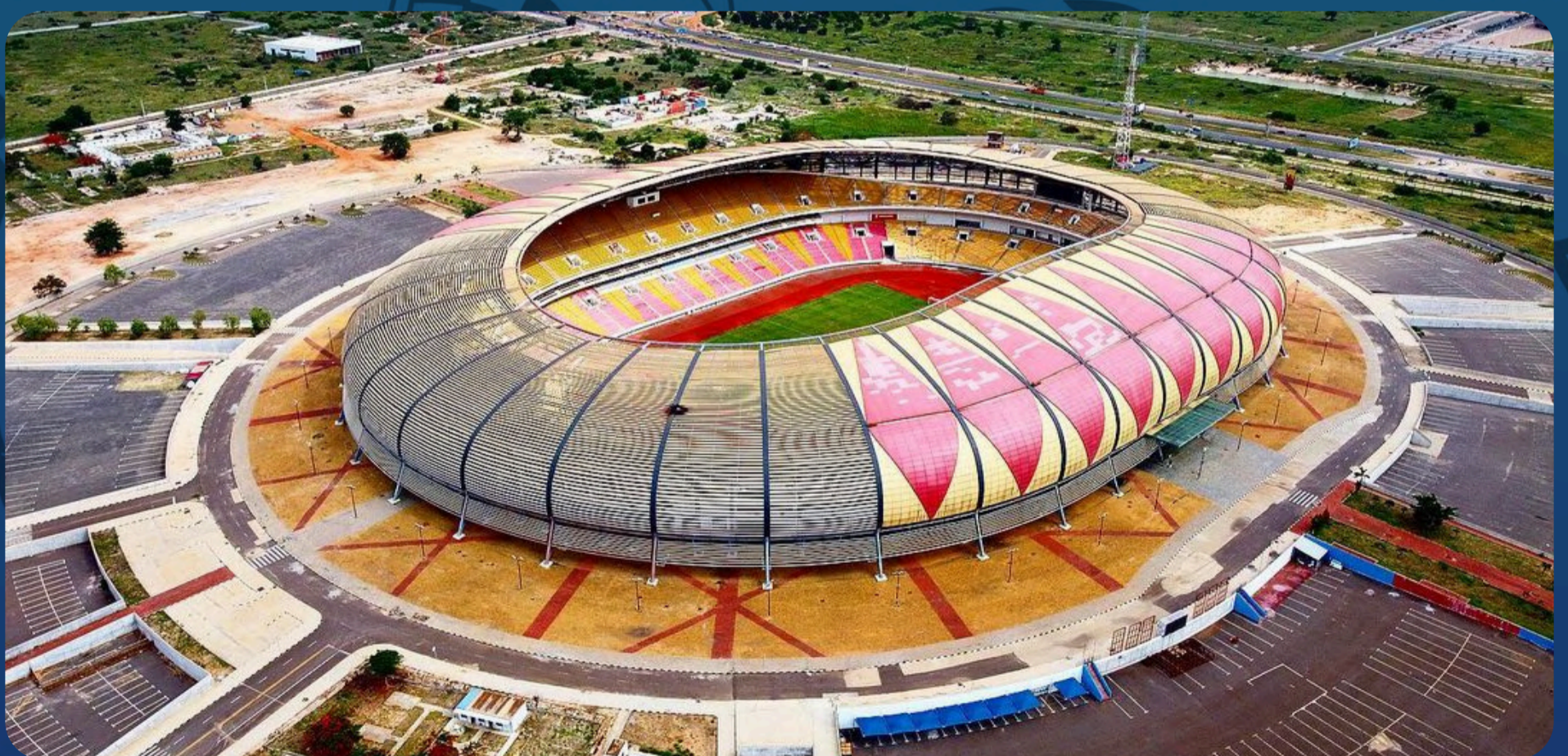
Estádio 11 de Novembro