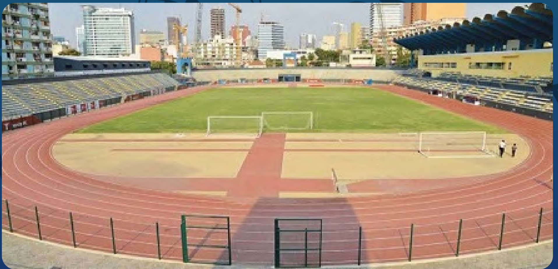
Estádio dos Coqueiros