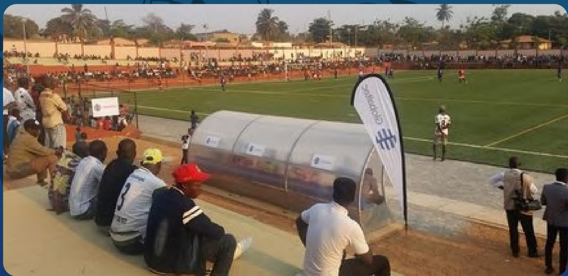
Estádio Álvaro Buta