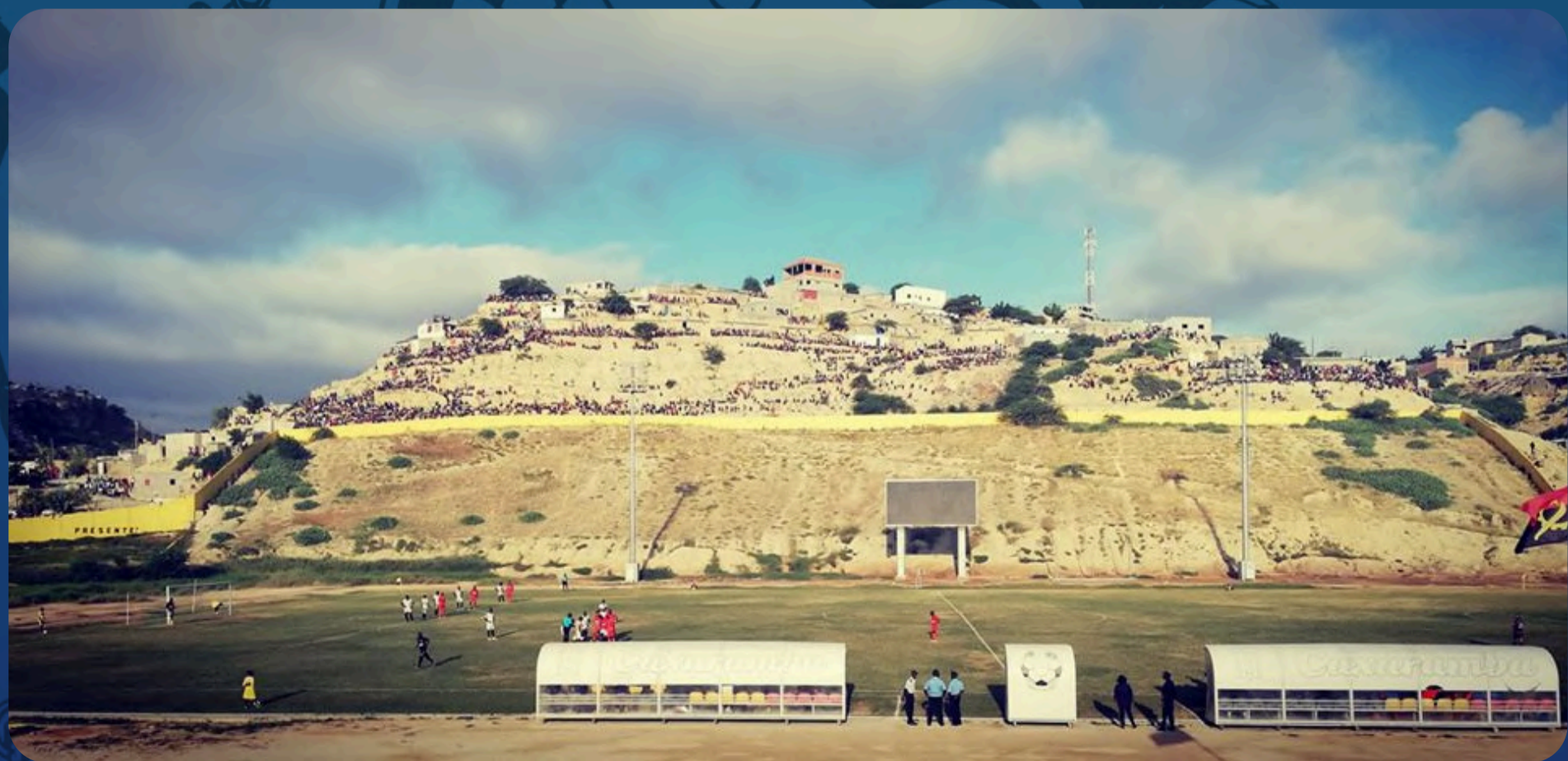
Estádio do Buraco