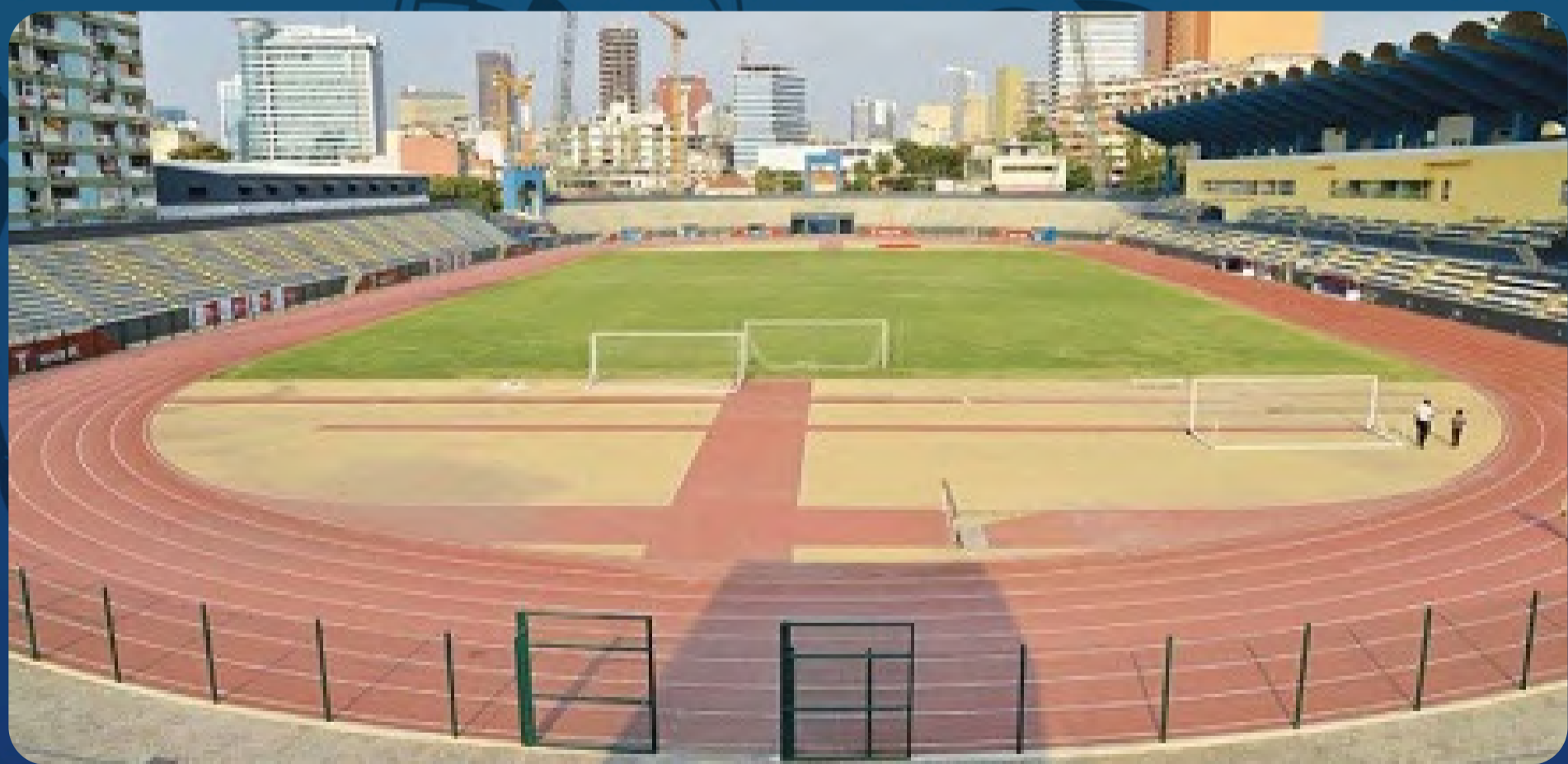
Estádio dos Coqueiros