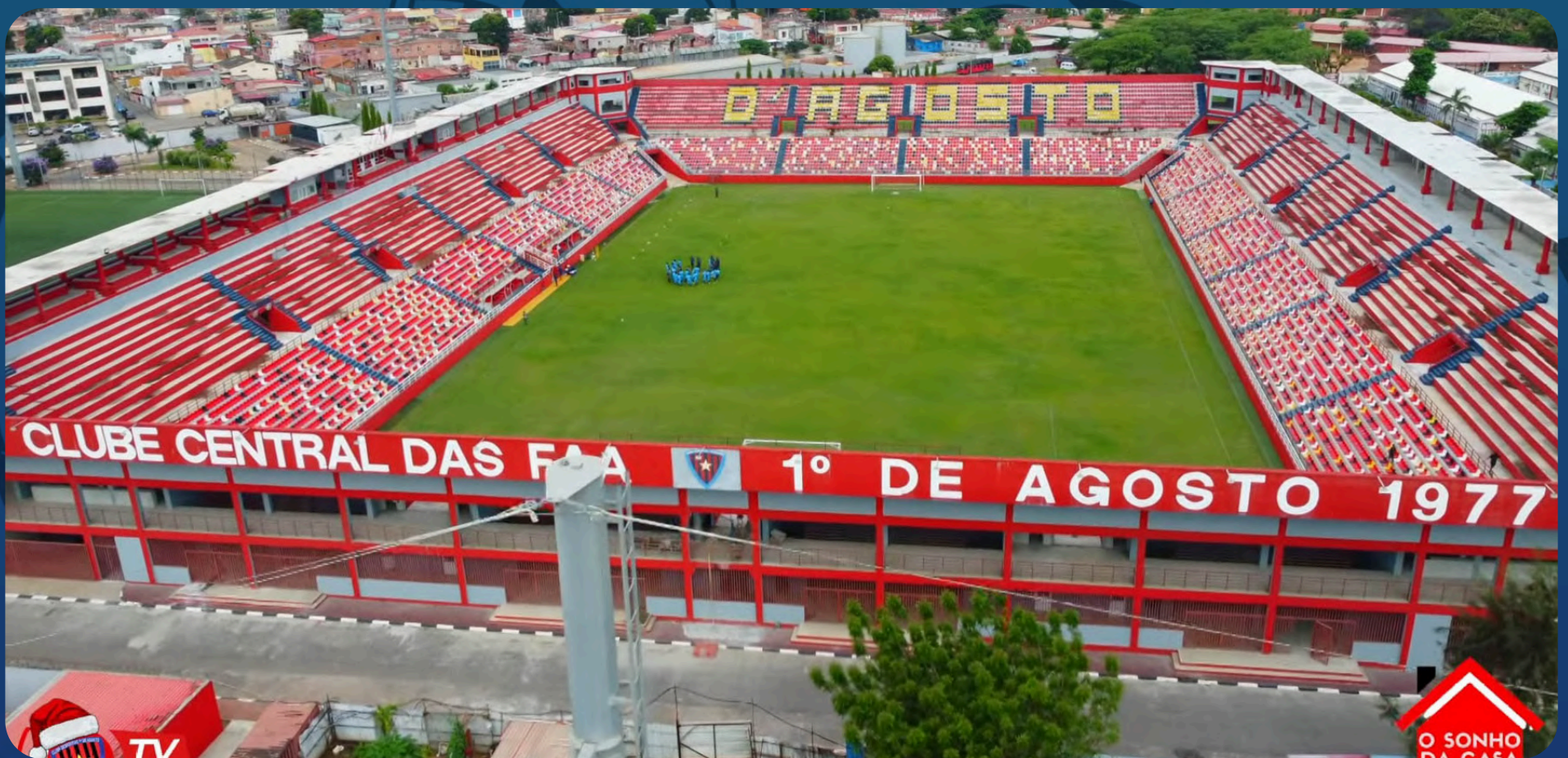
Estádio França Ndalu