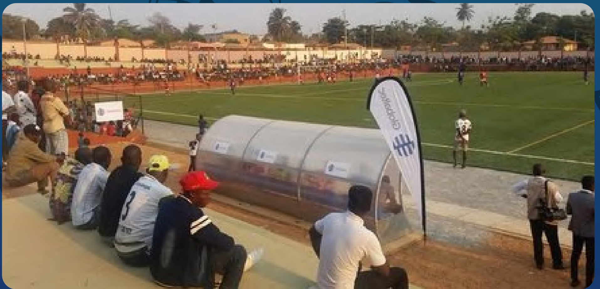
Estádio Álvaro Buta