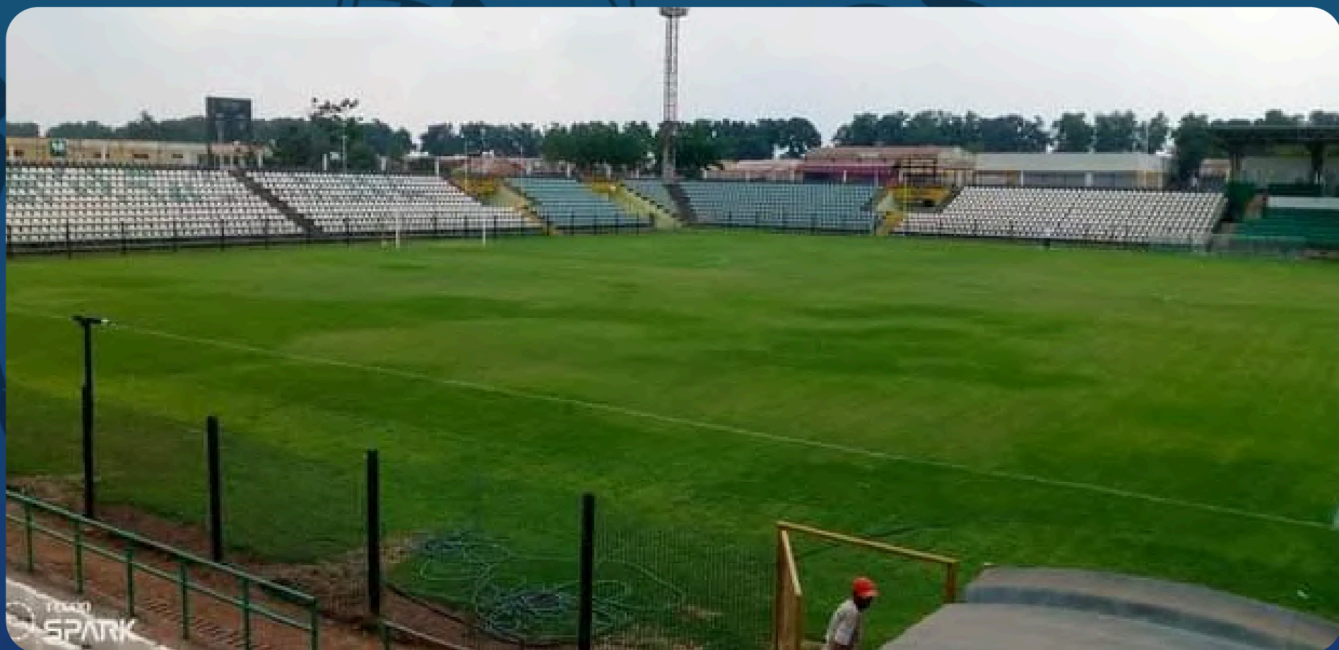
Estádio Sagrada Esperança